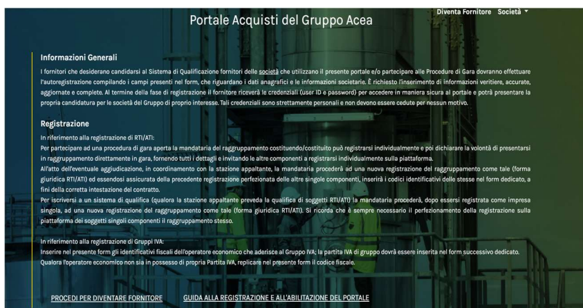
Figura 1.A. – Accesso e Registrazione

Nota: Utilizzare dati societari ufficiali e aggiornati.