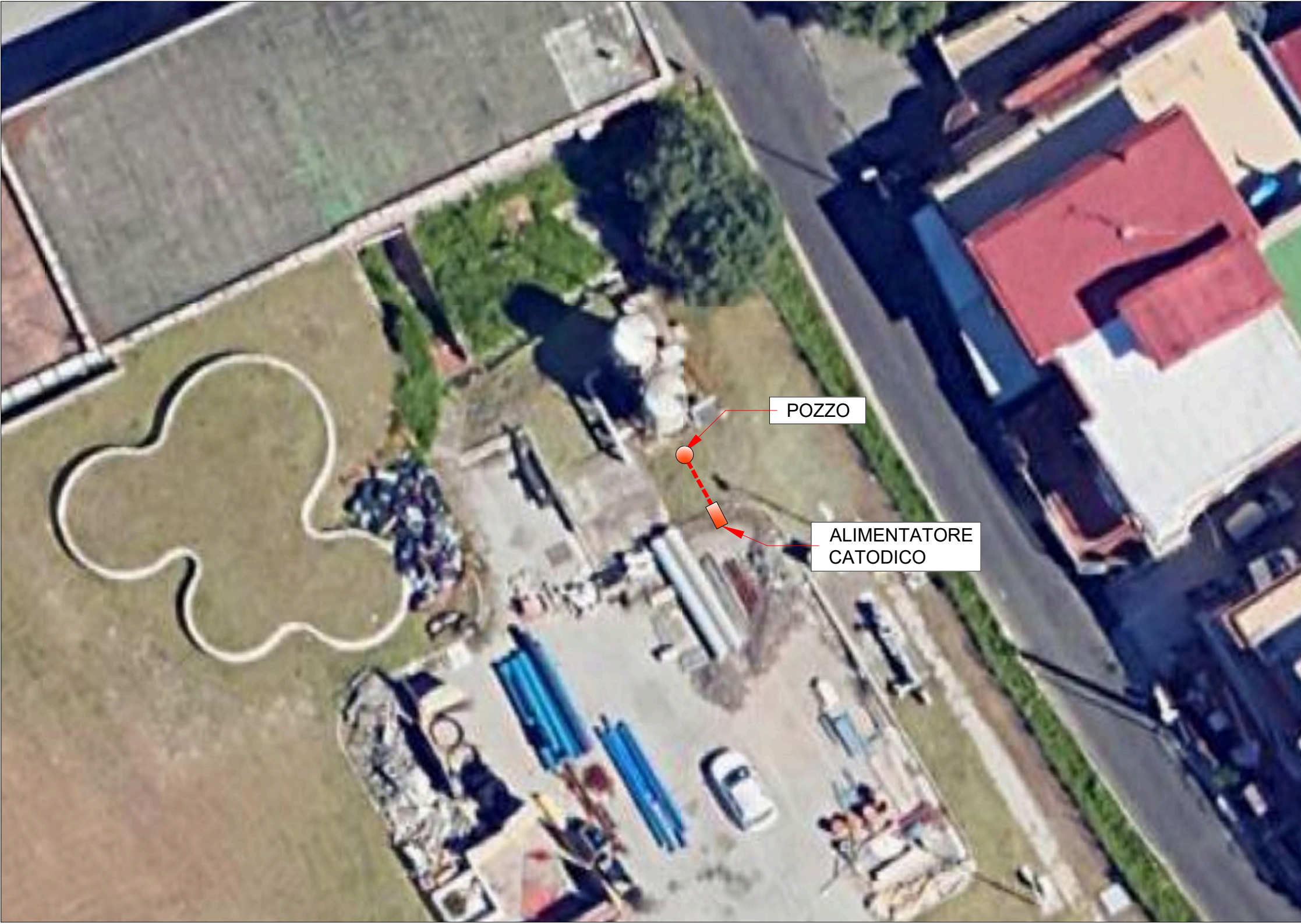
INQUADRAMENTO PLANIMETRICO SU ORTOFOTO - SCALA 1:200

NOTA. LADDOVE SIANO GIA' PRESENTI GIUNTI DIELETTRICI, L'IMPRESA E' TENUTA IN OGNI CASO A VERIFICARNE LO STATO DI CONSISTENZA ED IL CORRETTO FUNZIONAMENTO PER I PARTICOLARI COSTRUTTIVI SI RIMANDA AGLI ELABORATI C3,C4,C5,C6.