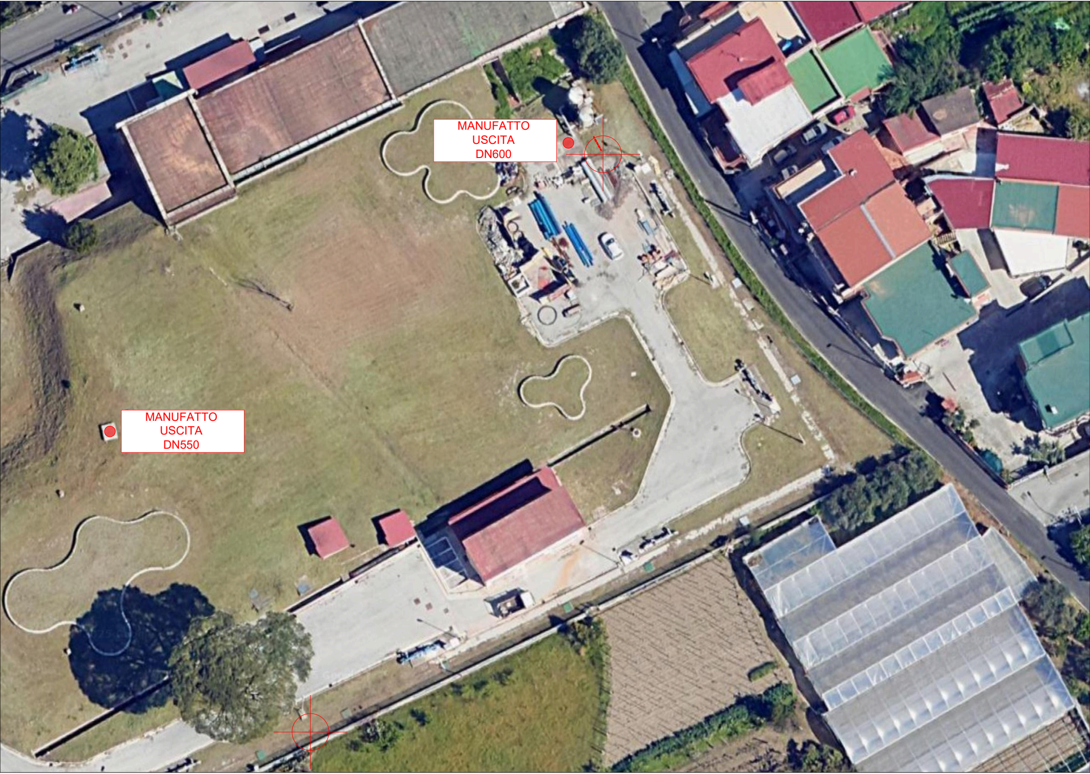
INQUADRAMENTO PLANIMETRICO SU ORTOFOTO - SCALA 1:500