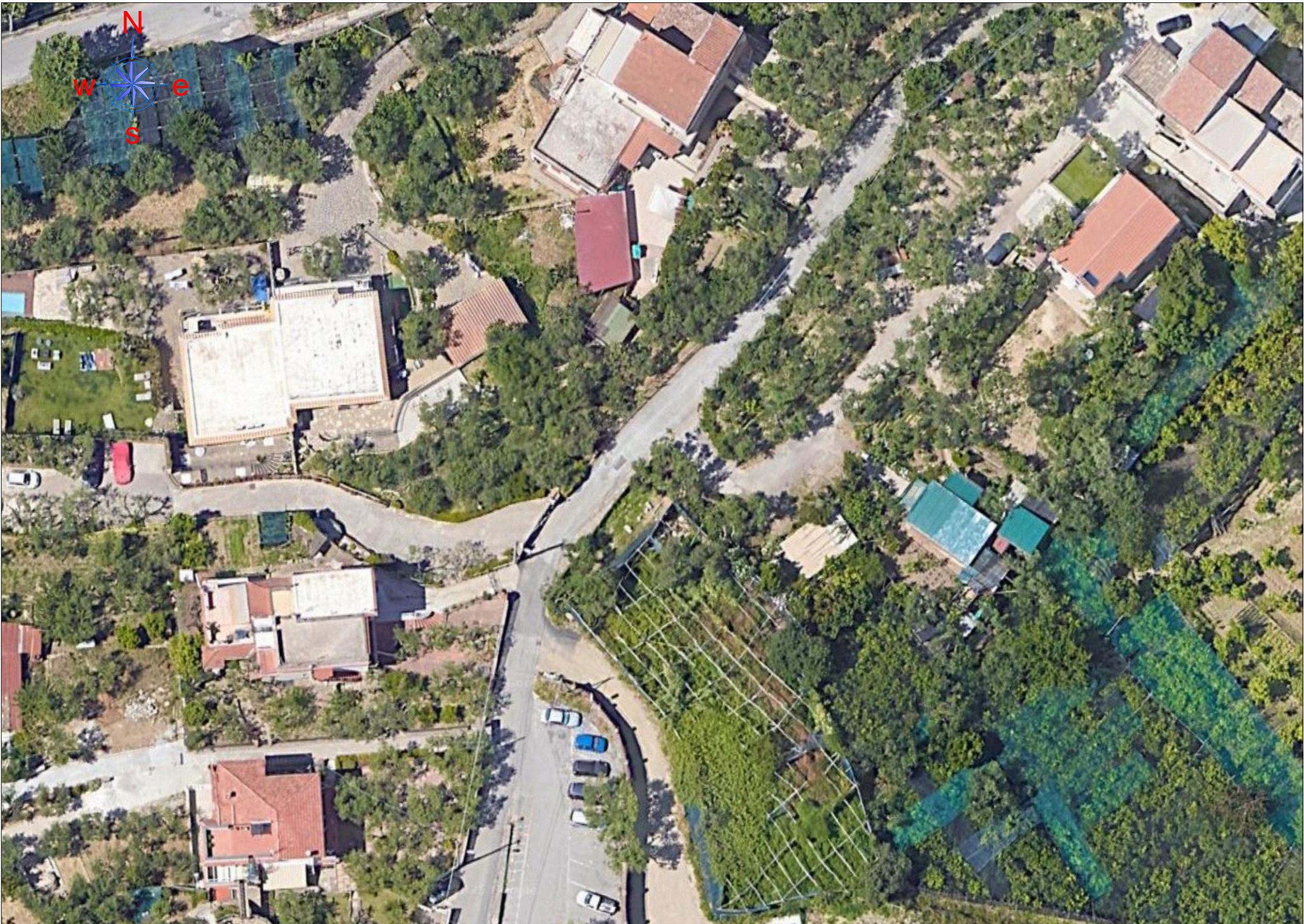
INQUADRAMENTO PLANIMETRICO SU ORTOFOTO - SCALA 1:500