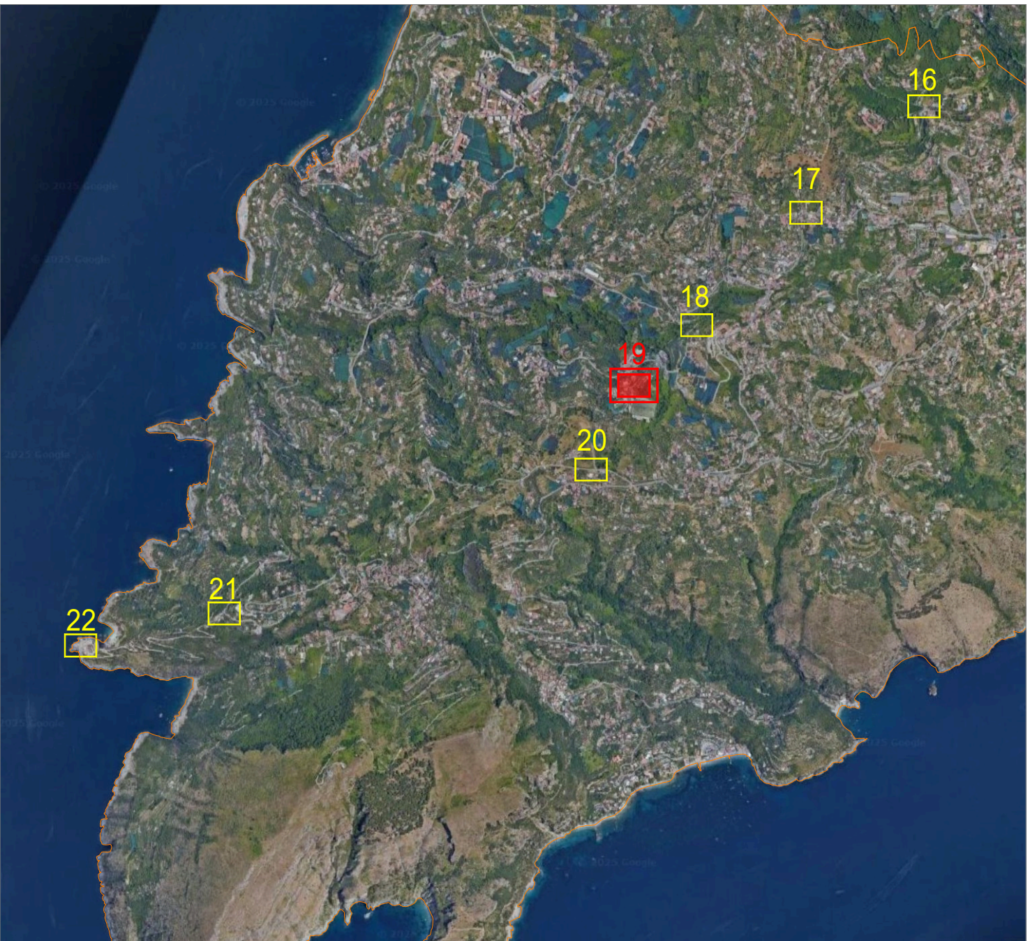
K-PLAN (SCALA 1:25.000)