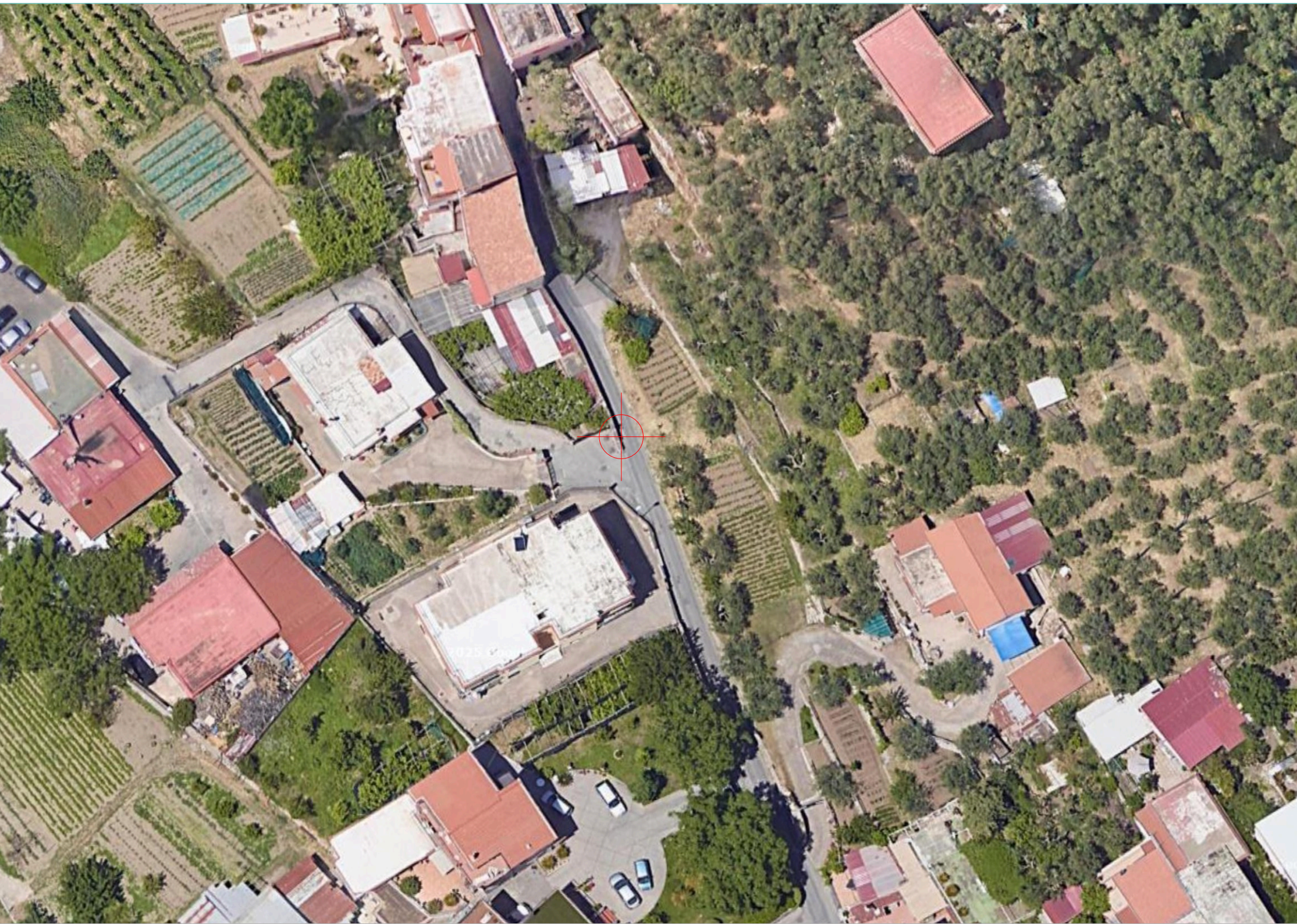
INQUADRAMENTO PLANIMETRICO SU ORTOFOTO - SCALA 1:500