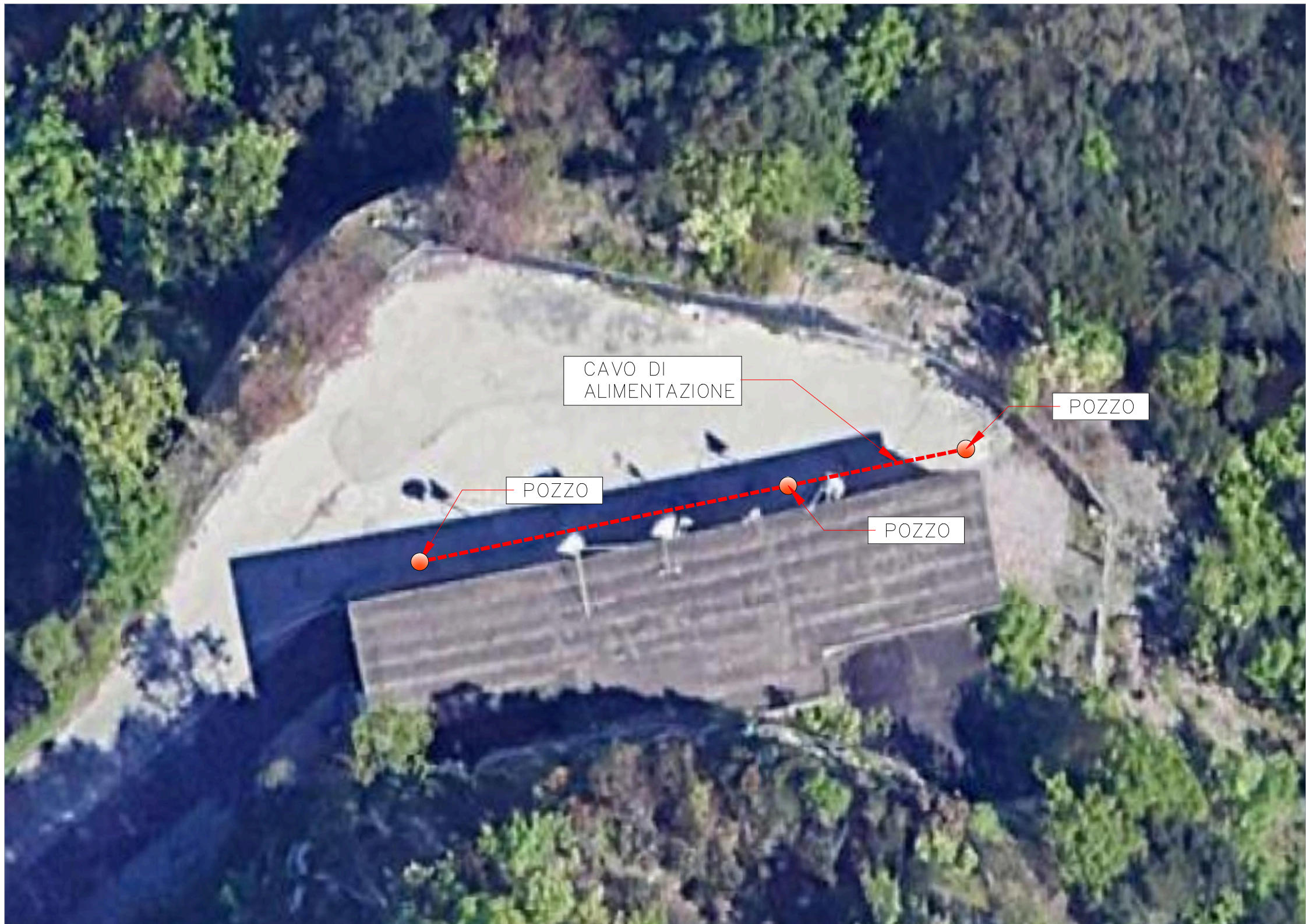
INQUADRAMENTO PLANIMETRICO SU ORTOFOTO - SCALA 1:200