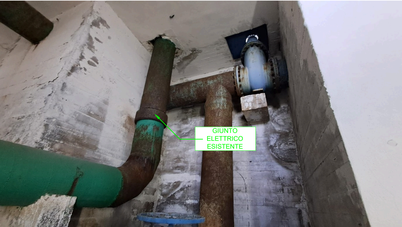
INGRESSO DN550 CON EVIDENZA DEL GIUNTO DIELETTICO

NOTA.1. LADDOVE SIANO GIA' PRESENTI GIUNTI DIELETTRICI, L'IMPRESA E' TENUTA IN OGNI CASO A VERIFICARNE LO STATO DI CONSISTENZA ED IL CORRETTO FUNZIONAMENTO