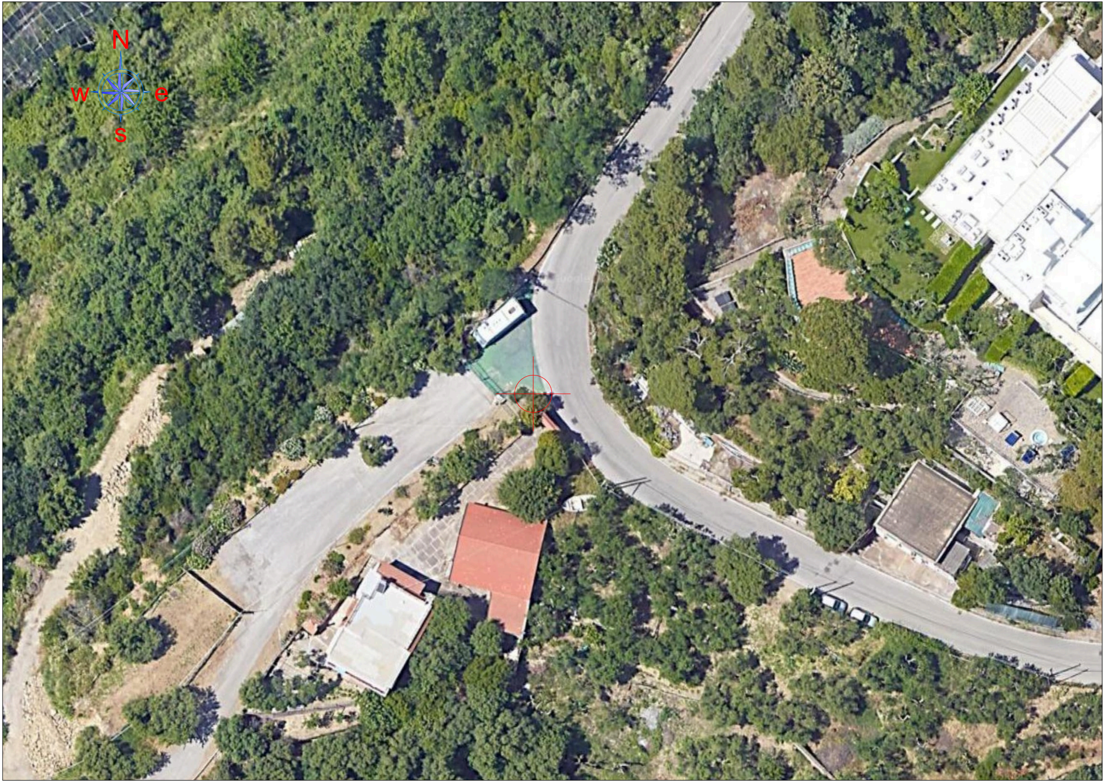
INQUADRAMENTO PLANIMETRICO SU ORTOFOTO - SCALA 1:500