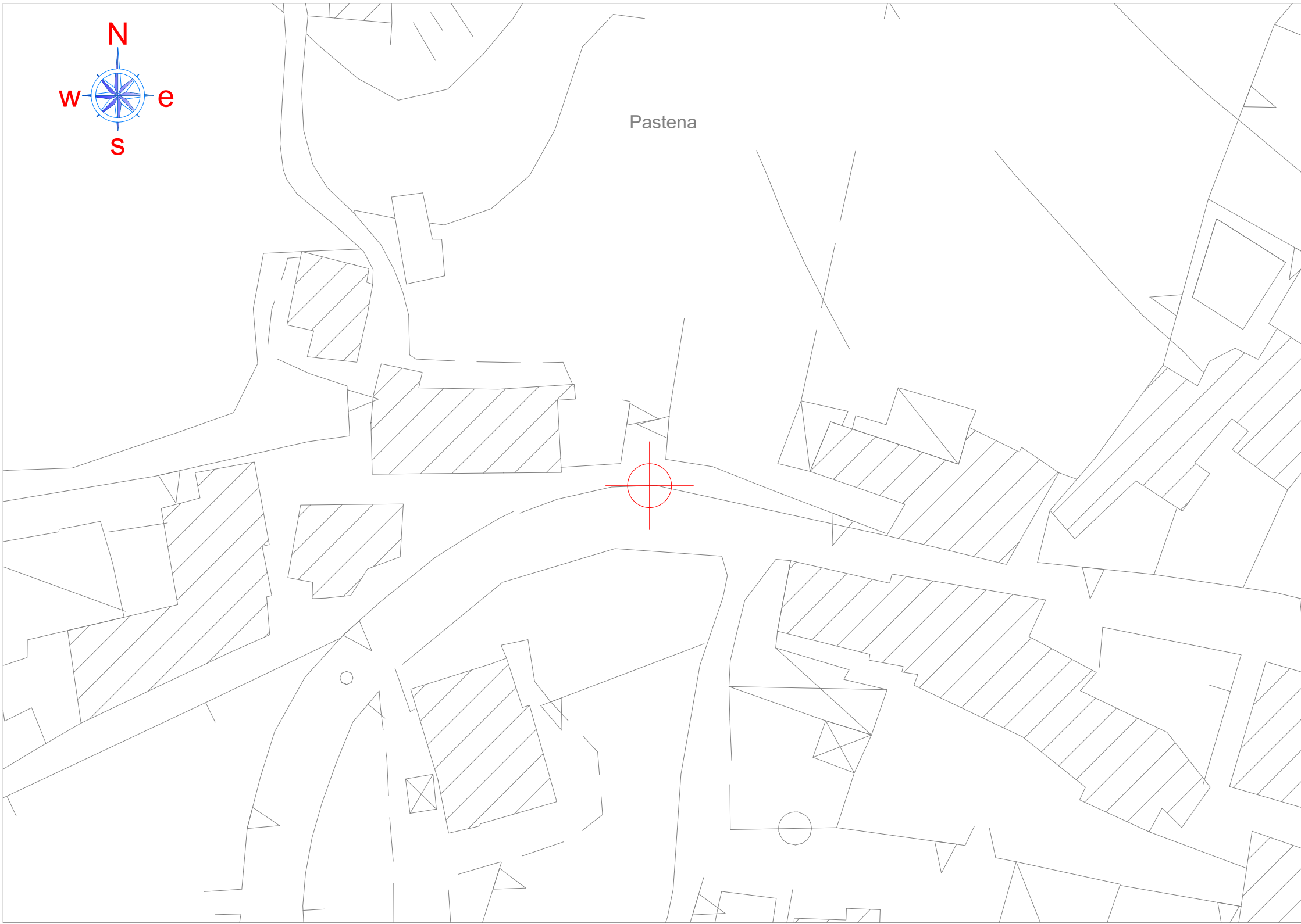
INQUADRAMENTO PLANIMETRICO SU CTR - SCALA 1:500