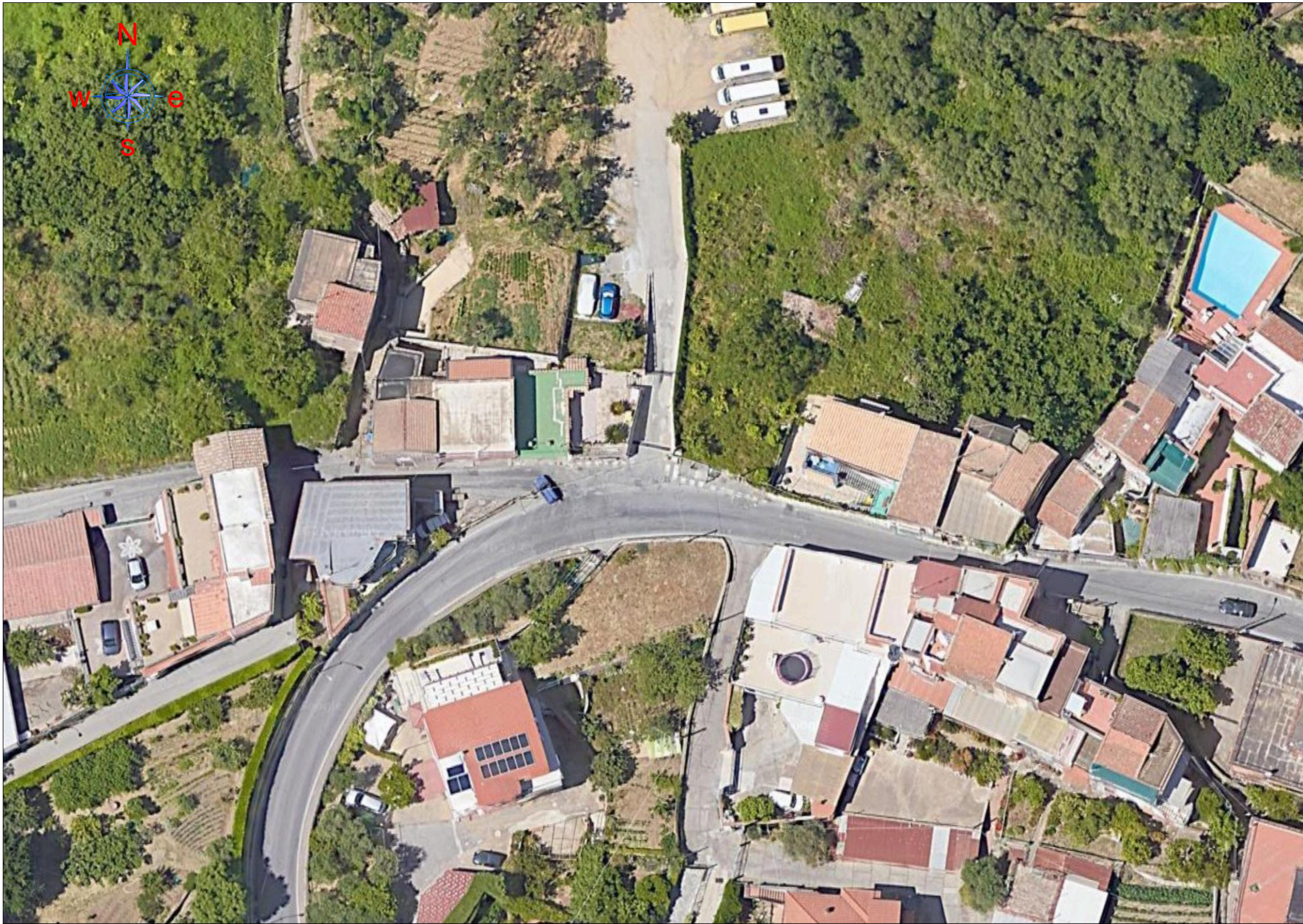
INQUADRAMENTO PLANIMETRICO SU ORTOFOTO - SCALA 1:500